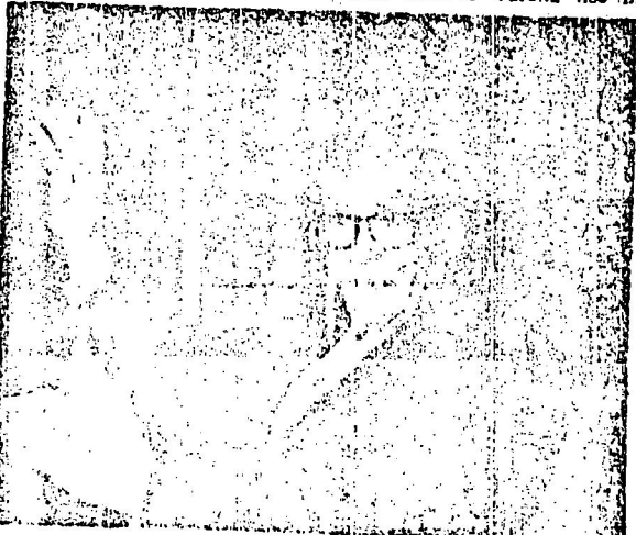
Tony Varona, intelectual y político cubano ampliamente conocido en el continente americano. Ayer dio trascendentes declaraciones para LA NACION a nuestro re-