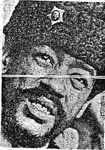
Lederen for det amerikanske «Black Panther»-parti, Bobby Seale, ved ankomsten til Fornebu.

— Vi godtar ikke betegnelsen «krigersk» (militant). Vi hevder nødvendigheten av selvforsvar, det har vist seg å være nødvendig. Selv Martin Luther King var ikke frem-